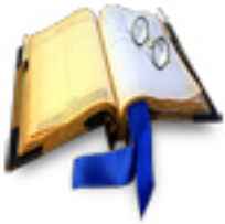
Lengua y Literatura